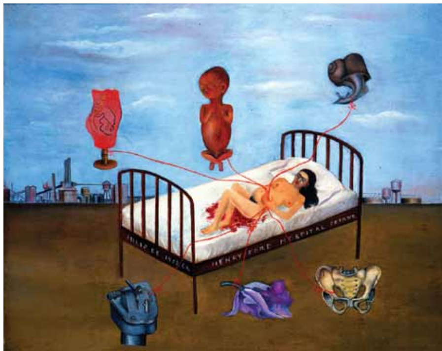
Szpital Henry Fond

być ono wizytówką sztuki naszej zachodniej cywilizacji... I zapewne też jest ukazując jeden z największych jej paradoksów: na te 35 tysięcy dzieł zaledwie garstka stworzona została kobiecą ręką. Fragonard, Vermeer, Rembrandt, Rubens, Tycjan, Poussin, daVinci... W tym świecie kobiety służyły jedynie za modele, które studiowało się niczym przedmioty: załamania światła, zaokrąglone kształty, kolor, faktura... Zjawiskowo piękne modelki, których kształty znane są każdemu na świecie, ale które już na zawsze zostaną bezimienne... W sztuce zachodnio-europejskiej braku-