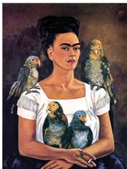
Autoportret z papugami

„Wiedziałam, że moje oczy są polem bitwy dla cierpienia. Od tego momentu zaczęłam patrzeć prosto w obiektyw aparatu, z niewzruszonym wyrazem twarzy, bez uśmiechu, zdeterminowana, by pokazać, jak dobrym jestem bojownikiem, który walczy do końca”