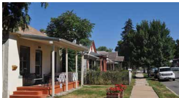
Sąsiedztwo dawnego Globeville - dzisiaj

Lady of Mount Carmel od 1894. Każda społeczność marzyła, aby posiadać swoją własną parafię. Emigranci nie chcieli „dzielić się” kościołami. To powodowało konflikty. Każda grupa etniczna różni się wszakże między sobą. Posiadanie osobnych kościołów i rozbudowa przykościelnych szkół pozwalała im na zachowanie swojej odrębności kulturowej