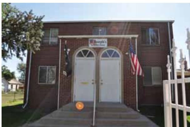
Dawny dom sióstr św. Józefa, dzisiaj mieści się tutaj dom starców dla weteranów wojennych