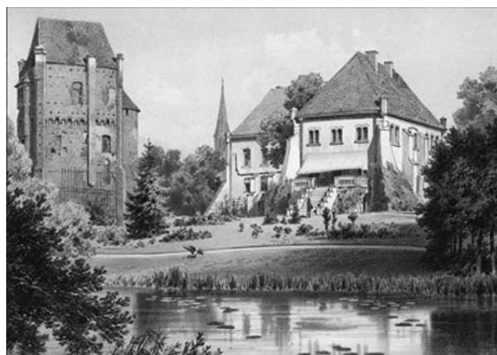
Pałac w Szamotulach koło Poznania

wśród ich małżonków i kiedy one czytywały modnych pisarzy francuskich, ich mężowie zabawiali się łowami. Podczas gdy kobiety przywdziewały